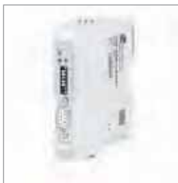
DP/CAN耦合器 CANopen® | 层2