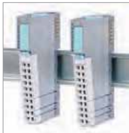
模拟输入模块 模拟输出模块