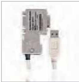
NETLink ® USB Compact, 微型PROFIBUS转USB网关