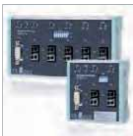
FLEXtra® FO, PROFIBUS光纤集线器 通用链接 | SMA | BFOC