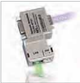
NETLink ® PRO Compact, PROFIBUS转以太网网关