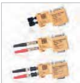
OPTopus, PROFIBUS光纤链接 通用链接 | SMA | BFOC