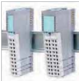
数字输入模块 数字输出模块 数字混合模块