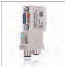
PROFIBUS连接器, 90° M12带有诊断LED