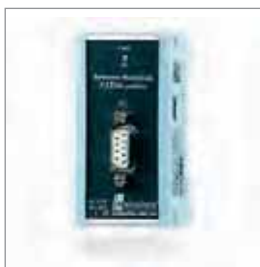
FLEXtra® profiPoint, 有源终端 和测量点