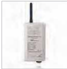
NETLink ® WLAN, PROFIBUS转以太网WLAN 网关