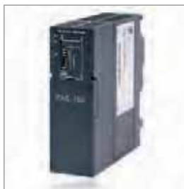
PAS 153, 分布式PROFIBUS接口