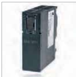
SAS 340/341, 通讯模块 带有Modbus RTU驱动, 带有1或2个接口