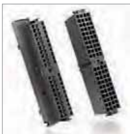
前连接器 螺钉触点 | 弹簧触点 EasyConnect®