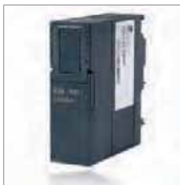
EIB 300, 用于Twisted Pair EIB/KNX的 通讯模块