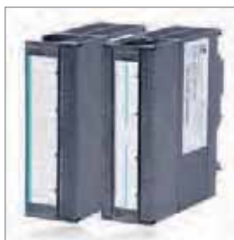
DEA 300/AEA 300 数字和模拟I/O模块