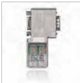
PROFIBUS连接器, 90° EasyConnect®