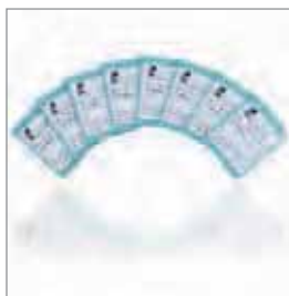
微型存储卡用于 西门子300系列