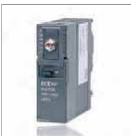
REX 300, 以太网路由器