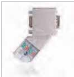
PROFIBUS连接器, 弯角 EasyConnect®