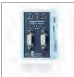
FLEXtra® twinRepeater, PROFIBUS双中继器