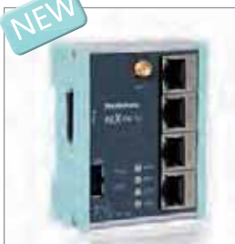
REX 100 3G, 以太网路由器