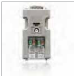
PROFIBUS连接器, 轴向 EasyConnect®