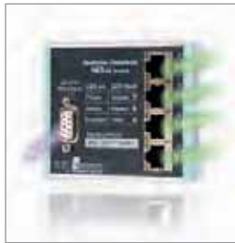
NETLink ® Switch, 以太网网关, 内置4口开关