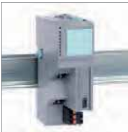
总线耦合器 PROFINET IO | PROFIBUS-DP CANopen ® | ModbusTCP EtherNet/IP