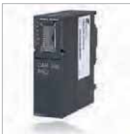
CAN 300 PRO, 通讯模块