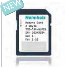
存储卡用于 西门子1200/1500系列