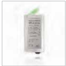
NETLink ® PRO PoE, PROFIBUS转以太网网关 网关