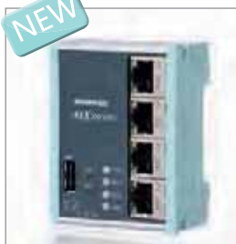
REX 100 WAN, 以太网路由器