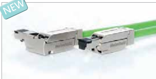
PROFINET连接器, RJ45, 180° 或 90°