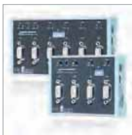
FLEXtra® multiRepeater, 4/6-路PROFIBUS中继器