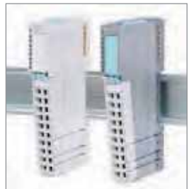
系统模块 电源和隔离模块 电势分配器