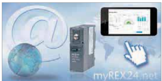
myREX24 VPN Portal | WEB2go, 用于移动数据访问